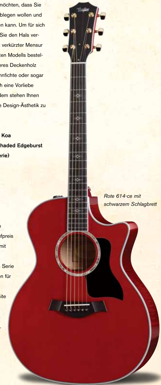
Rote 614-ce mit schwarzem Schlagbrett

Manche Optionen sind nur für eine bestimmte Serie erhältlich. Eine vollständige Liste unserer Optionen für Standardmodelle und Preise entnehmen Sie bitte unserer Preisliste für 2013, die auf unserer Website unter taylorguitars.com zugänglich ist. Sollten Sie weitere Fragen haben, können Sie sich jederzeit an Ihren Taylor-Händler wenden oder uns anrufen.