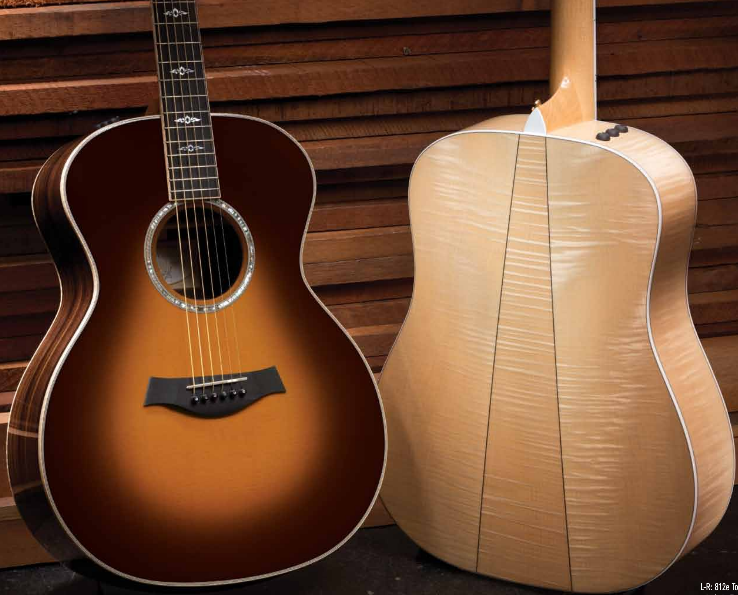
L-R: 812e Tobacco-Sunburst-Decke; Ahorn 610e mit dreiteiligem Boden