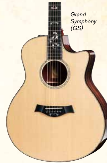
Grand Symphony (GS)