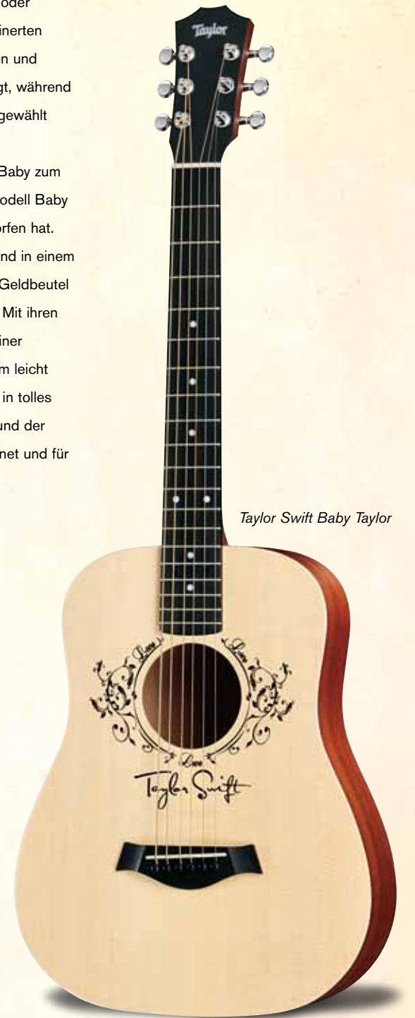
Taylor Swift Baby Taylor

Taylor Guitars unterstützt seit langem den Musikunterricht in Schulen. Im Jahr 2000 ging Taylor eine Partnerschaft mit der San Diego Music Foundation ein, um Guitars for Schools zu unterstützen. Im Rahmen dieses Programms werden öffentlichen Grund- und Mittelschulen im Großraum San Diego Gitarren bereitgestellt. Seither wurden rund 1.700 Gitarren an 100 Schulen gespendet und den Schätzungen zufolge erhielten über 20.000 Grundschüler Gitarrenunterricht im Klassenzimmer. Im Oktober besuchten wir eine Gruppe von Musikschülern der High Tech Grund- und Mittelschule. Sie waren sichtlich erfreut, ihre Baby Taylors zu zeigen.