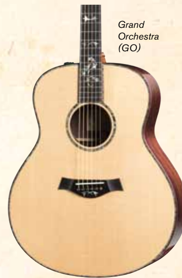
Grand Orchestra (GO)