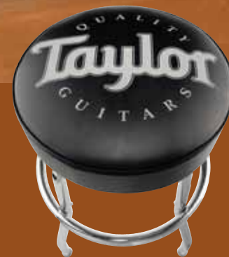
Taylor Bar Stool. Easy assembly. (#70200)

gift box included. (#71025) 10) Ultem Picks. Ultem is a strong space-age resin with limited flex that produces a clean, crisp tone. It closely resembles real tortoise shell in sound and feel, but unlike tortoise shell, will not fracture. Ten picks per bag; one gauge per bag. Thin (.50 mm), Medium (.80 mm) or Heavy (1 mm). (Translucent gold with brown Taylor round logo, #8077) 11) TaylorWare Gift Card. Visit our website for more information. 12) Digital Headstock Tuner. Clip-on chromatic tuner, back-lit LCD display. (#80920) 13) Taylor Etched Mug. 15 oz. mug with Taylor hand-etched into one side. (Black #70007)