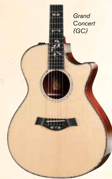
Grand Concert (GC)