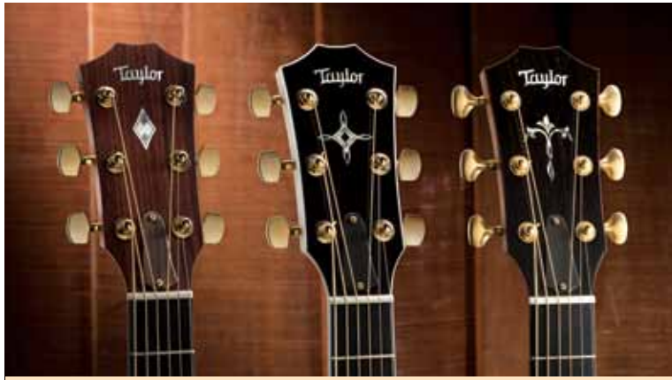
Oben: Intarsien-Kopfplatten der First-Edition-Modelle der Grand Orchestra. L-R: 518e, 618e, 918e; Rechts: Ausblick von der Torrey-Pines-Felsenküste auf den Black's Beach; Gegenüberliegende Seite (L-R): 518e, 618e

entscheidende Moment ist jedoch der, in dem er einen Prototyp der neuen Gitarre aus Palisander und Fichte aufnimmt, um deren tonales Wesen vorzuführen. Er streicht ein paar offene Akkorde, die im Raum nachklingen und deren Kraft und Fülle mit langem Sustain andauern.