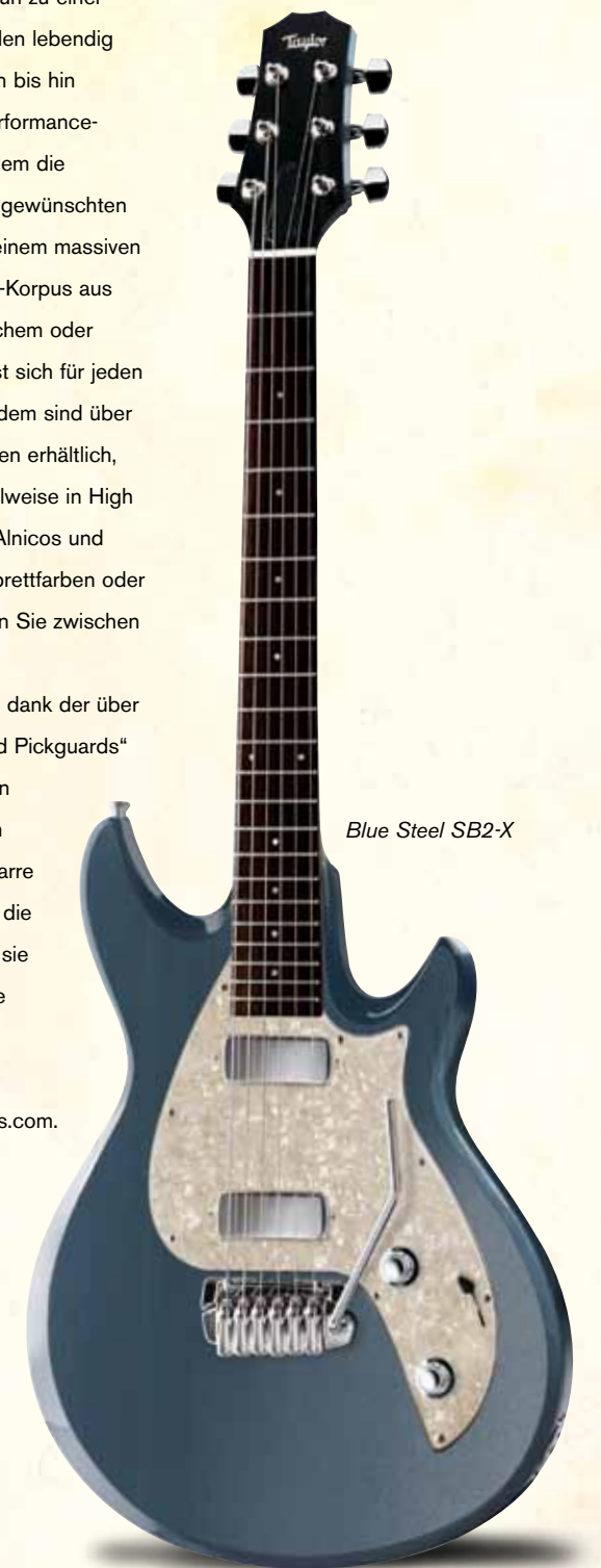
Blue Steel SB2-X

SolidBody Standard mit doppeltem Cutaway und Vintage-Alnico-Humbucker in Gaslamp-Schwarz; SolidBody Classic mit einfachem Cutaway, schwarzem Pickguard, 3 Singlecoils und Tremolo-Steg in Tobacco Sunburst