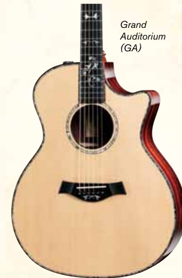
Grand Auditorium (GA)