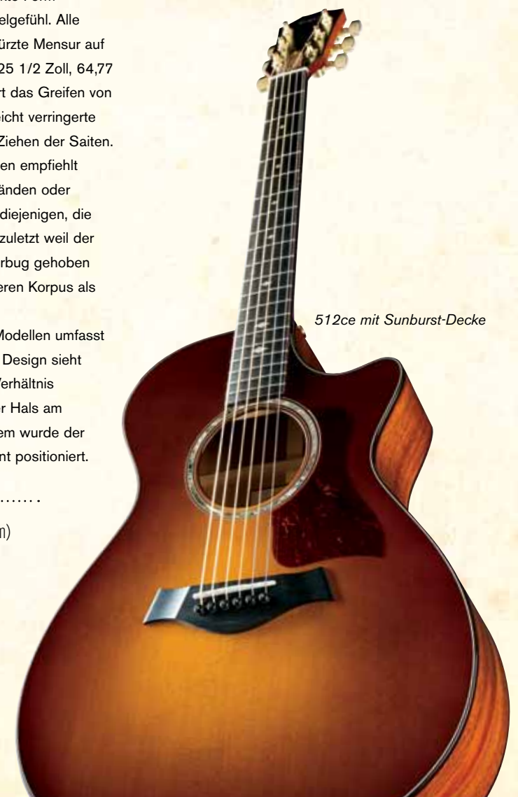
512ce mit Sunburst-Decke